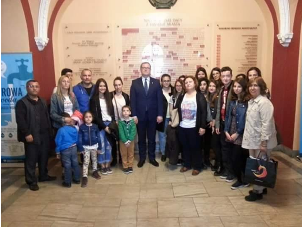
*Yurt Dışı Proje Gezilerimiz