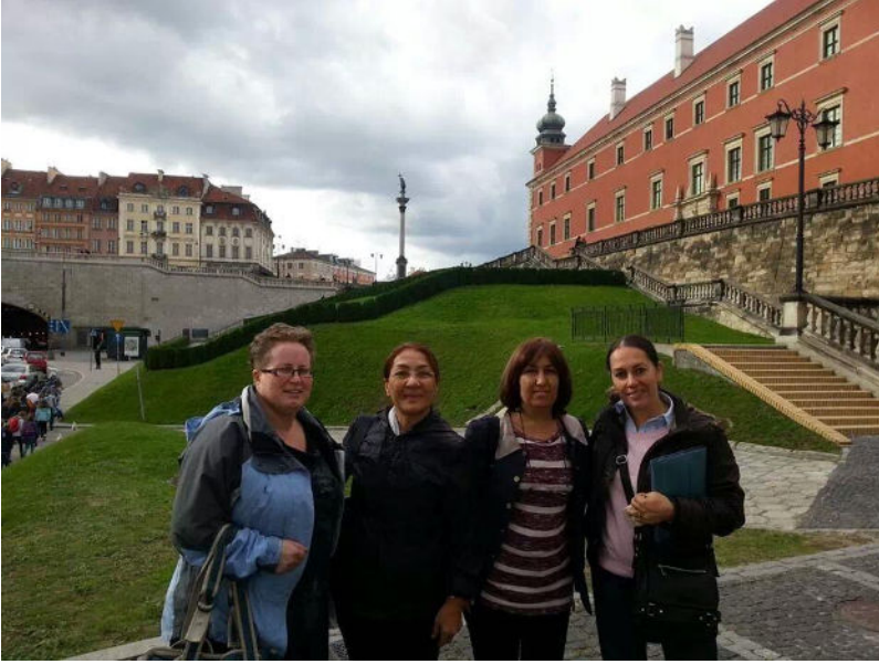
Polonya AB Proje Toplantısı Ziyareti