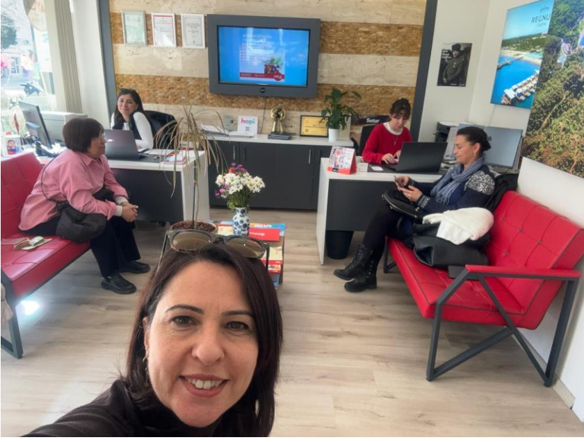
*Seyahat Acentası Kardeş Okul Ulaşım Görüşmesi