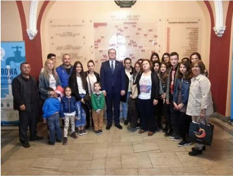
*Yurt Dışı Proje Gezilerimiz