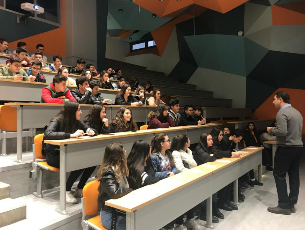
* İstanbul Üniversite tanıtım gezisi